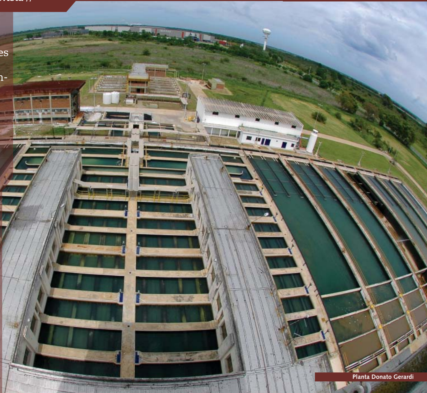
Planta Donato Gerardi

ABSA posee 14 establecimientos potabilizadores y 662 perforaciones, de las cuales 84 fueron construidas desde el inicio de la gestión. Éstas producen mensualmente más de 23,5 millones de metros cúbicos de agua potable, destinados a cubrir las necesidades de 600 mil hogares.