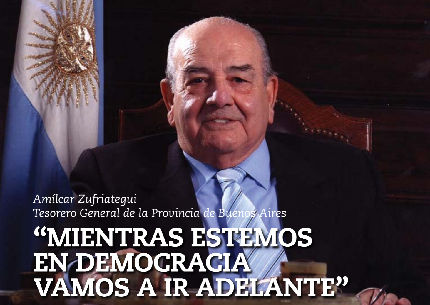
Amílcar Zufriategui Tesorero General de la Provincia de Buenos Aires