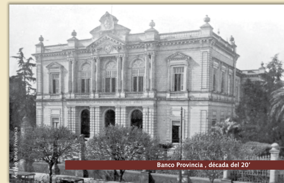
Banco Provincia, década del 20'