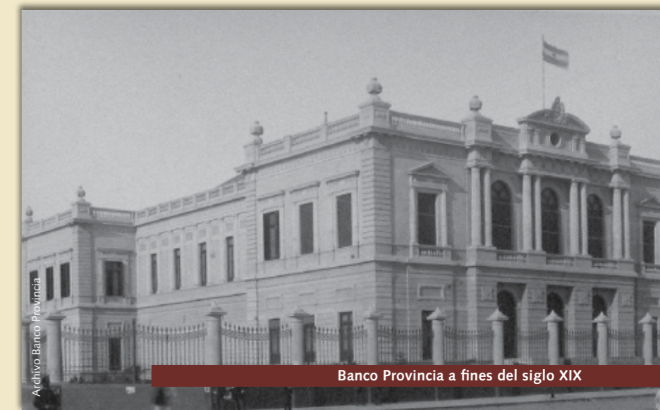
Banco Provincia a fines del siglo XIX

En 1863 asumió la denominación definitiva Banco de la Provincia de Buenos Aires, con casa central y sucursales. En 1882, luego de la fundación de Ciudad de La Plata, capital de la Provincia de Buenos Aires, se inaugura la actual Casa Matriz, en la Avenida 7 entre 46 y 47 que por sus características de edificio palaciego, rodeado de jardines en todo su perímetro, le confieren un carácter excepcional dentro del patrimonio arquitectónico del Banco y de la arquitectura bancaria de la época.