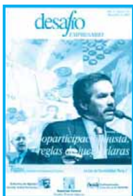
Tapa 16 de la revista Desafío Empresario, diciembre de 2003

El gobierno nacional se comprometió a aportar 300 millones de pesos para destinarlos al pago del aumento docente. En el presupuesto de la Provincia, el monto previsto para aumento de la totalidad de los estatales era de 600 millones. De acuerdo con el análisis de la consultora Economía & Regiones, si el incremento salarial se incorpora al básico de todos los docentes, representará un gasto adicional de 1.540 millones de pesos.